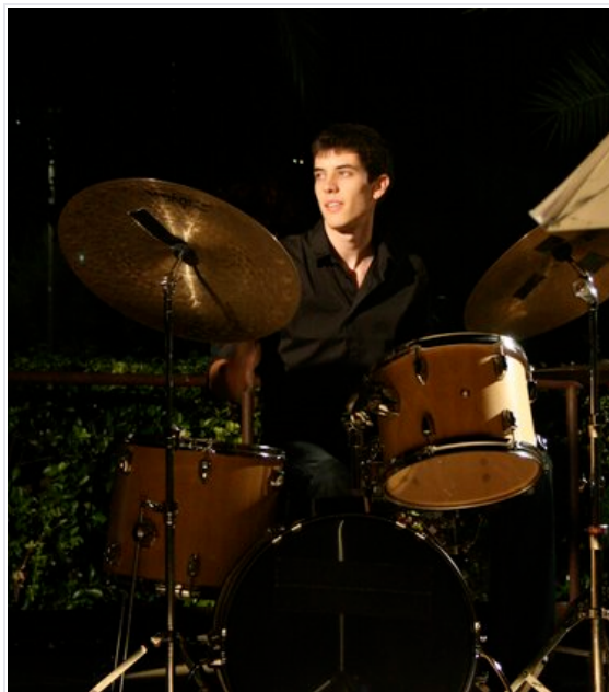
El percussionista alyurgellenc, que debuta aquesta nit a Ordino al capdavant del Projecte Pirene

–Una pregària per fer ploure que es cantava al Pallars, cançons de bressol; la Dama d'Aragó, una de les balades més